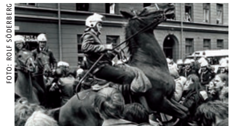
Kvarteret Mullvaden. Krummakargatan i Stockholm 1977 till 1978. Huset revs till slut och på platsen finns i dag bostadsrättsföreningen Ockupanten.

Den kanske längsta ockupationen pågår fortfarande. I början av 1970-talet ockuperades det före detta militärområdet Christiania i Köpenhamn. I dag, 37 år senare, bor här 800 personer. Danska staten vill att Christiania ska omvandlas till en stadsdel som alla andra.