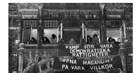
Hagahuset. Allaktivitetshuset Hagahuset i Göteborg ockuperades i samband med att det skulle stängas 1972.