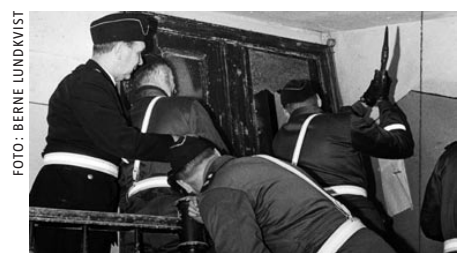
Västra Mårtensgatan 5 och Kiliansgatan 7. Första ockupationerna i Sverige skedde i Lund sommaren 1969 under slagordet ”Tomma hus är allas hus”.