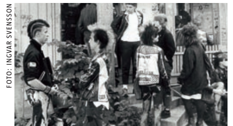
Ultrahuset. Ultrahuset i Haninge ockuperades när kulturföreningen Ultra tvingades flytta 1987. Efter ockupationen brann huset ned.