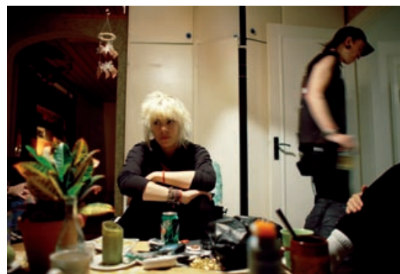
Till läns. Det är inte deras hus egentligen. Men det blir deras hem. Tio personer bor här permanent, många fler sover över varje natt.