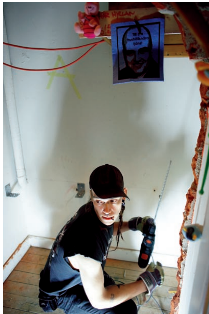
Hemmafixare. Dagar och många nätter ägnas åt att renovera huset. I rökrummet ska en trasig fåtölj ersättas med en väggfast soffa.