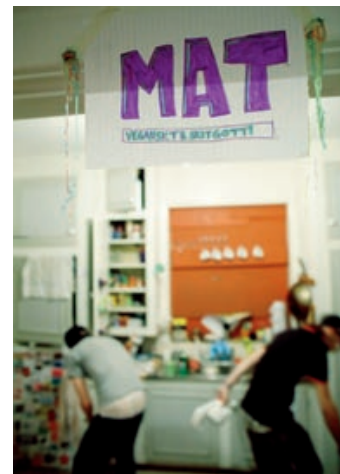
Vegokök. Finns på bottenvåningen. Köttköket ligger en våning upp.