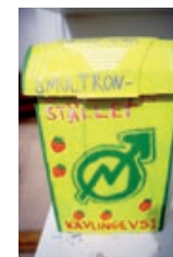
Smultronstället. Det var det gulligaste namnet de kunde komma på.